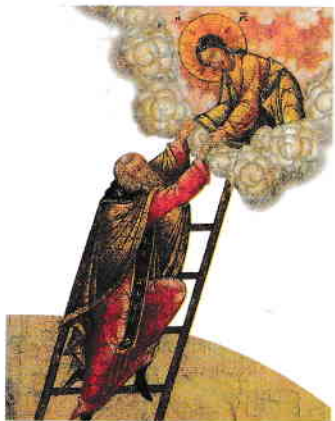
Scara Sfântului Ioan Scărarul