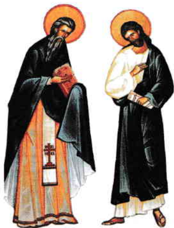
Sfinții Mucenici Epictet și Astion

Prin viața lor pământească plină de virtuți și fapte bune, sfinții au ajuns la asemănarea cu Dumnezeu, devenind fiii Lui după har. Ei au răspuns cu toată ființa lor iubirii dumnezeiești, în diferite contexte social-istorice.