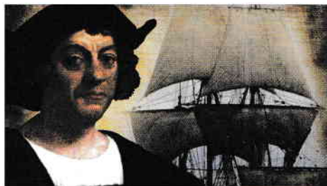
Cristofor Columb (1451-1506)

În Sfânta Scriptură, grădina raiului, unde au fost așezați Adam și Eva, este localizată între râurile Fison, Gihon, Tigru și Eufrat. Învățătura Mântuitorului ne arată că fericirea omului nu este condiționată de locul în care trăiește, ci de modul în care își duce viața.